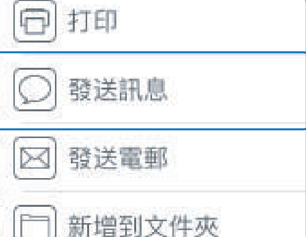
全新“發送訊息”選項